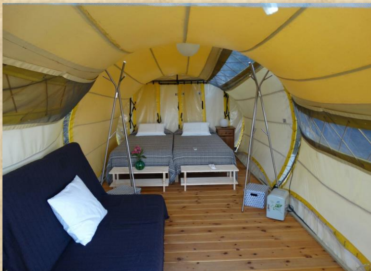
ORUGAMI Con baño privado al aire libre Para 2 personas