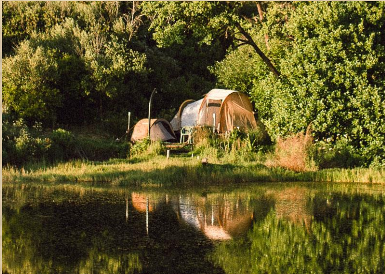
TIENDAS DEL LAGO Con baño privado al aire libre Para 2 personas