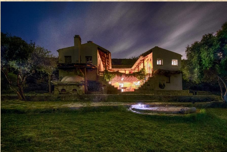
LA CASA PRINCIPAL