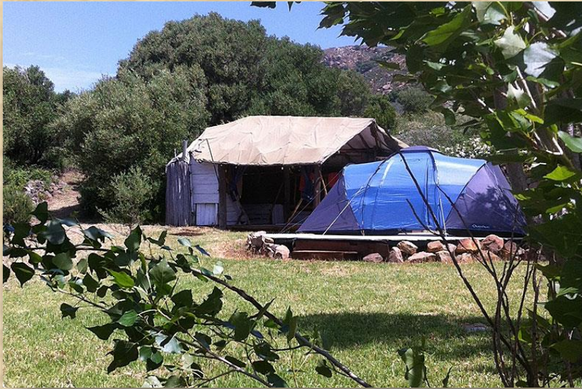
TIENDAS ExcTATIC Con baño privado al aire libre Para 2/4 personas